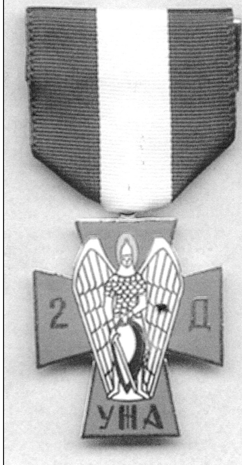
Ювілейний Хрест 2-ої дивізії УНА

куринь смерті Українських Січових Стрільців), оскільки раніше, десь із середини 17-століття, вся кіннота Московщини була зформована майже виключно із українських полків, наприклад, один з яких, – Олександрійський полк гусарів, – також мав відзначення «чорний».