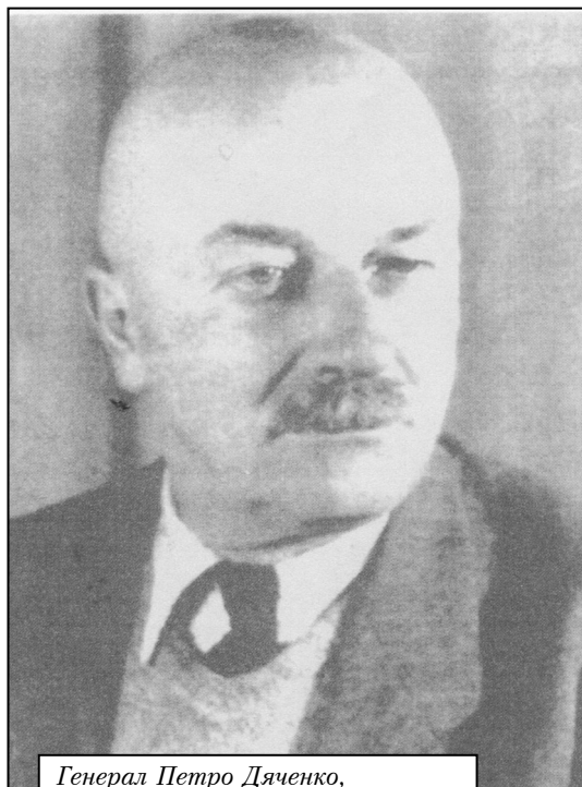
Генерал Петро Дяченко, командир 2-ої УД УНА

Але мені цього було замало. І я вирішив поїхати до родинного села генерала Дяченка, у Березову Луку на Полтавщині, аби наживо доторкнутися до місцевості, яка дала життя й зростила цього українського Патріота. Несподівано виявилось, що, не-