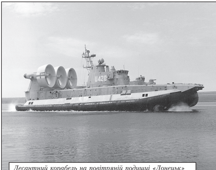
Десантний корабель на повітряній подушці «Донецьк»

тим тризубом посередині. Ці ескізи були прийняті загальним рішенням офіцерського та мічманського складу екіпажу корабля управління «Славутич» та затверджені командиром корабля капітаном 3 рангу В. Мандичем. За шефської допомоги у м. Миколаєві було виготовлено три комплекти цих прапорів. Саме з такими прапорами корабель управління «Славутич» увійшов до Севастополя у листопаді 1992 року. [2, с. 14].