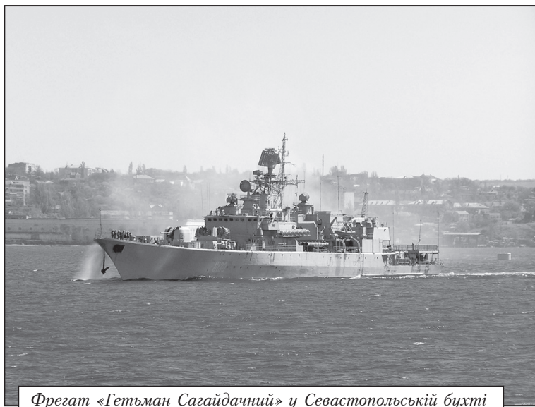
Фрегат «Гетьман Сагайдачний» у Севастопольській бухті

Прапор був схожий на прапор флоту УНР зразка 1918 року, гюйс мав вигляд прямокутника синього кольору із золо-