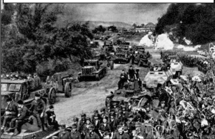
Пересування німецьких військ окупованою територією в 1941 р.

нові літаки у ВПС СРСР поступалися німецьким. Особливо Vf-109, G-10 чи FW-190, Ju-87. Тим не менше, ВПС СРСР мали літаків майже у 6 разів більше, ніж люфтваффе, але і на них можливо було битися і перемагати [11, с. 29–30].