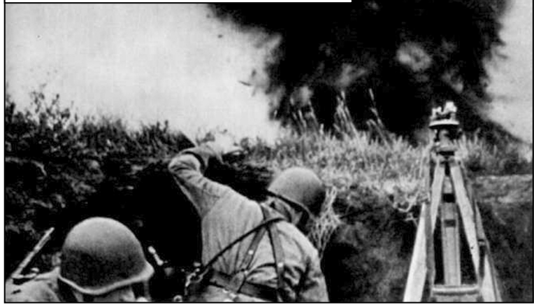
Оборонні бої на рідній землі. 1941 р.

ві – 23,9 млн. військовозобов'язаних, які підлягали призову в ЗС [23, с. 120]. Й. Сталін взагалі вважав, що кількість – це теж якість.