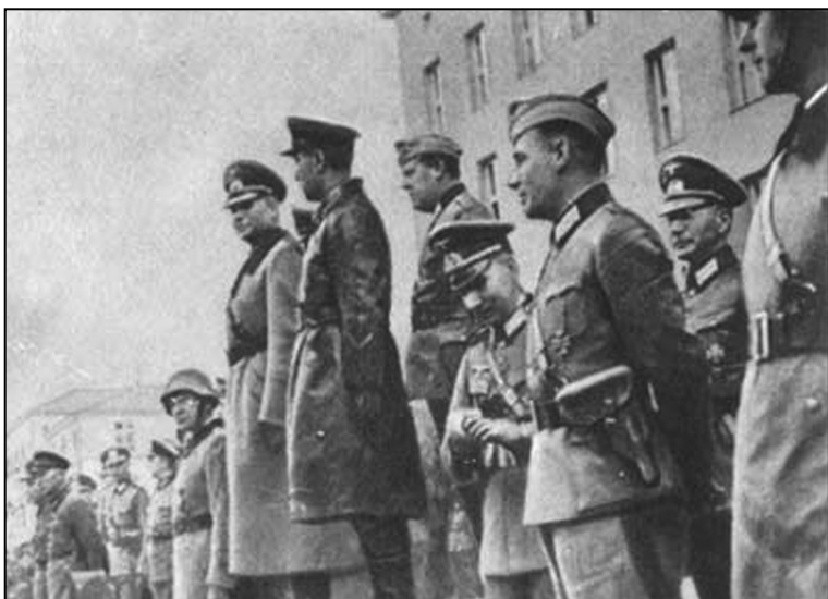
Парад переможців у Бресті. В центрі – Гудеріан та Кривошеїн

Через 11 днів, 17 квітня 1941 року, Югославія капітулювала, а 23 квітня припинила опір і Греція. 28 квітня 1941 року німці провели блискучу повітряно-десантну операцію, захопивши о. Крит, який боронили англійці. А. Гітлер показав Й. Сталіну, хто в Європі хазяїн. Сталін це «стерпів», з жалем констатує, що війна виявилась неминучою. Проте 8 червня 1941 року Радянський Союз розірвав дипломатичні відносини з Югославією, а 3 червня – з Грецією, як було раніше зроблено і з Бельгією,