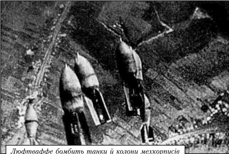
Люфтваффе бомбить танки й колони мехкорпусів Червоної армії. 1941 р.

США та Англії від Європейських проблем та забезпечити нейтралітет Японії на період розгрому Німеччини та «визволення Європи від капіталізму» [1, 341]. З 15 червня 1941 року керівництво СРСР почало пропонувати Рейху нові переговори. Й. Сталін хотів знати наміри Німеччини та розгорнути свої Збройні сили. Якщо б переговори не відбулися, це дало б змогу Радянському Союзу розпочати бойові дії. Але А. Гітлер мовчав. Це означало єдине – війну.