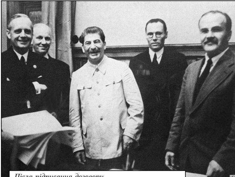
Після підписання договору

які мали 704 винищувачі проти 3067 літаків люфтваффе, ефективна протиповітряна оборона, локація англійців врятують гітлерівських генералів від необхідності приводити в дію план «Морський Лев», однак до того, як А. Гітлер переніс 17 листопада 1940 року операцію вторгнення в Англію на весну 1941 року, збираючи по всій Європі баржі та транспортні судна. Разом з тим вже у вересні 1940 року він прийме рішення напасти на СРСР, віддавши перевагу плану «Барбаросса», а не Близькому Сходу.