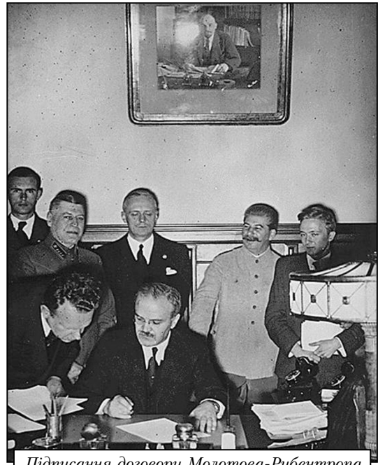
Підписання договору Молотова-Ріббентропа

Як розвивалися стосунки між СРСР та Німеччиною з липня 1940 по липень 1941 року? Які ж були плани сторін, співвідношення сил та засобів, їх якісна характеристика, як почалася війна між двома державами та як проходив її початковий період, якими були втрати сторін та причини поразок і невдач Червоної армії?