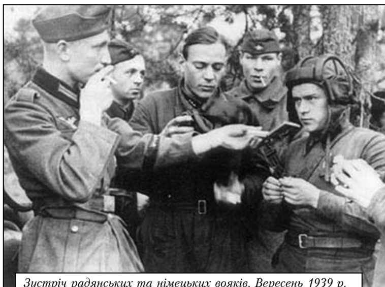
Зустріч радянських та німецьких вояків. Вересень 1939 р.

А. Гітлер у липні 1940 року опинився перед дилемою – з ким воювати: з Англією, з СРСР, йти на Близький Схід чи Північну Африку? І він вирішує відмовитись від негайної висадки в Англію, а просуватися