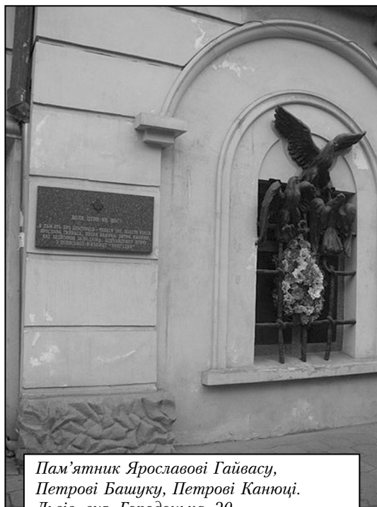
Пам'ятник Ярославові Гайвасу, Петрові Башуку, Петрові Канюці. Львів, вул. Городоцька, 20

27 травня 1946 року цей підрозділ разом з польським підпіллям «Воля і незалежність» відзначився під час спільного наступу на м. Грубешів [15].