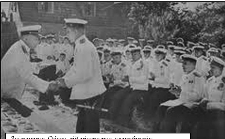
Звільнення Одеси від німецьких загарбників

приймає рішення одночасно з підготовкою прориву у районі Березівки форсувати річку в районі Завадівки і розвивати наступ у напрямку Раухівки, Котовського, Андріївки, головний удар нанести у напрямку Вікторівки, Нейково – в обхід противника, який протистоїть механізованому корпусу, і створити передовий загін для захоплення Сталіно. 9 гв. кд рішучим ударом захопила залізничну станцію і