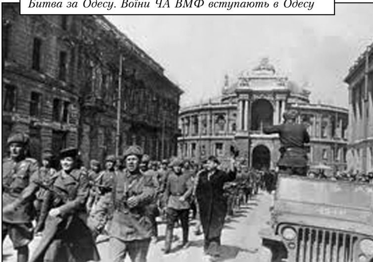
Битва за Одесу. Воїни ЧА ВМФ вступають в Одесу