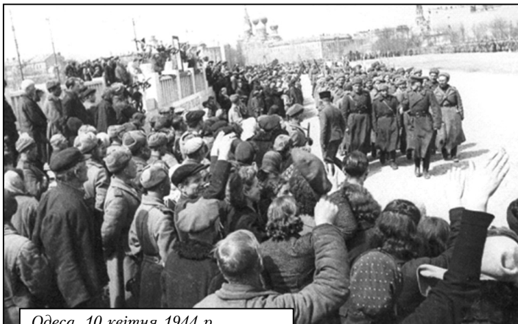
Одеса. 10 квітня 1944 р.

поставлене завдання частиною сил захопити Овідіополь, відрізати шляхи відходу противника до переправ через р. Дністер, а головними силами вийти на узбережжя Чорного моря трохи південніше Одеси.