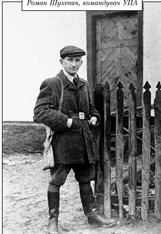
Роман Шухевич, командувач УПА

ського підпілля, був досвідченим у пропагандистській роботі, саботажі [9, 227].