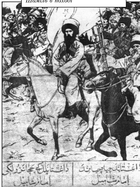
Шаміль в поході

зайняті царськими військами, поширювали там відозви Шаміля. На відміну від своїх попередників, Шаміль розумів, що боротьба з царизмом може бути успішною лише за умови рішучої боротьби з її союзниками в середовищі горців в особі феодальної і експлуататорської верхівки. Тому, пропагуючи вчення про газават, війни з «невірними», Шаміль підкреслював, що «невірними» є не тільки царизм і його військо, але і мусульмани, які допомагають царизму і зраджують інтереси народу. Шаміль закликав не тільки до боротьби з завойовниками, але і до боротьби проти феодальних власників ханів, беків, шамхалів і їх прибічників, які допомагали царату. Шаміль вважав ворогами мюридизму різних дагестанських власників, яких царський уряд підкуповував і які опиралися розповсюдженню мюридизму і боролися проти Шаміля.