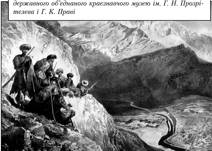
Напад горян Шаміля. Ілюстрація із зібрань Ставропольського державного об'єднаного краєзнавчого музею ім. Г. Н. Прозітелєва і Г. К. Праві

Намагаючись нічим не порушити тишу, Шаміль з оголеною шашкою в руці і рушницею за плечима пішов вперед серед численних постів. При виході з ущелини сталася сутичка з одним із секретів, в якій загинуло кілька воїнів Шаміля. Під час прориву ворожого ланцюга один солдат поранив багнетом в коліно сина Ша-