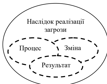
Рисунок 1 – Наслідок прояву загрози економічній безпеці (розроблено автором)

Крім того, слід указати на бінарну сутність поняття «загроза», оскільки, як показано вище, вона