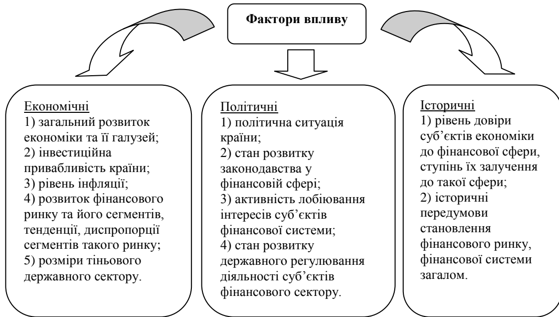
Рис. 1. Фактори впливу на ефективність діяльності суб'єктів фінансового сектору.

Наприклад, розвиток галузей промисловості призводить до зростання окремих видів фінансових послуг, що пов'язані з підприємництвом; інвестиційна привабливість впливає на процес залучення інвестицій окремими суб'єктами фінансового сектору; розвиток тіньового ринку призводить до зростання відповідних схем відмивання грошей за участю суб'єктів фінансової системи, що обумовлює недовіру суб'єктів економічної діяльності до неї. Політична нестабільність впливає на розвиток економіки, а отже й фінансової сфери. Незадовільний стан законодавства у фінансовій сфері ускладнює механізми функціонування фінансової системи, виважену державну політику у фінансовій сфері, державний нагляд та контроль, створює ряд обмежень щодо розміщення резервів тощо. Історичні фактори формують довіру, загальне відношення економічних суб'єктів до фінансової системи [2].