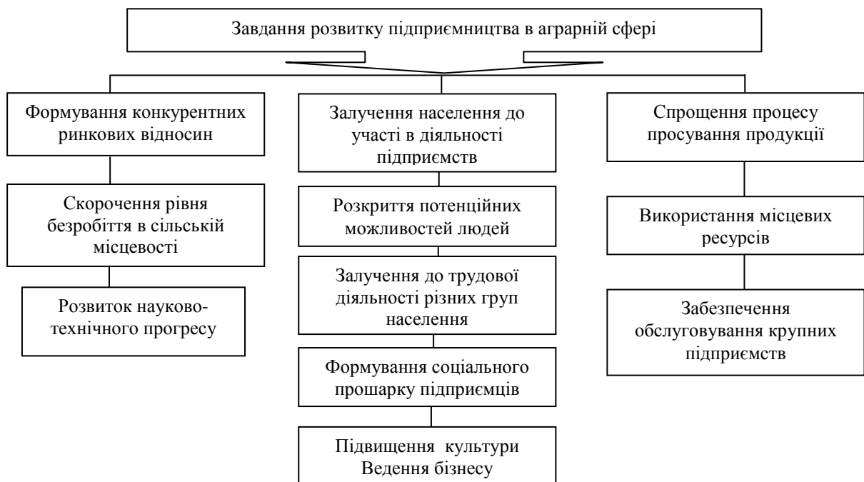
Рис. 1. Завдання підприємництва в аграрній сфері

Розвиток підприємництва в аграрному секторі покликаний вирішити наступні завдання економічної реформи країни (рис. 1.)