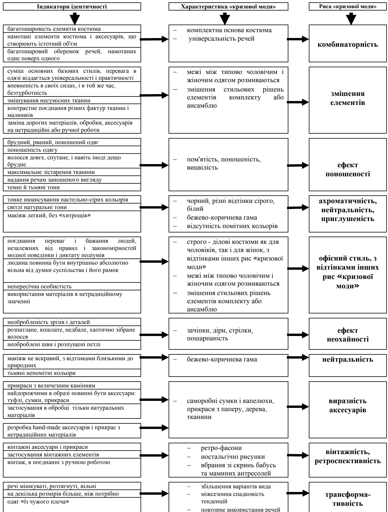
Рис. 2. Фіксація найбільш стійких ознак формування проектного образу споживача при розробці модних образів в контексті так званої «кризової моди»