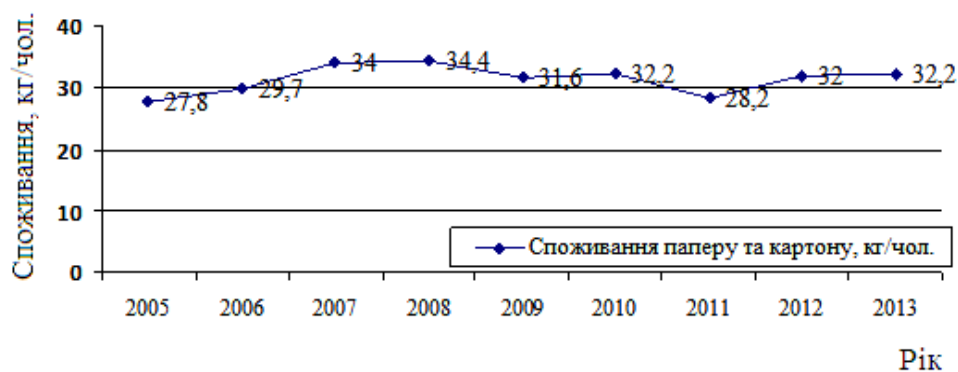
Рис. 1. Споживання паперу та картону в рік на душу населення в Україні

Як зазначалося вище, стан розвитку целюлозно-паперової промисловості характеризується загальноприйнятим у різних країнах показником споживання картонно-паперової продукції на душу населення. В Україні на одну особу сьогодні припадає 32,2 кг паперу та картону на рік, що майже вдвічі нижче від рівня середньосвітового споживання, який становить 70 кг на рік (рис. 1) [11].