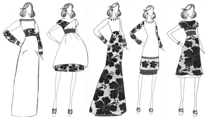
Рис. 2. Колекція одягу для вагітних з підтримуючим ефектом

Прагнення створити одяг для вагітних жінок в українському стилі та передати любов матері до майбутньої дитини сформувало колекцію для майбутніх мам та її дизайн (рис.2).