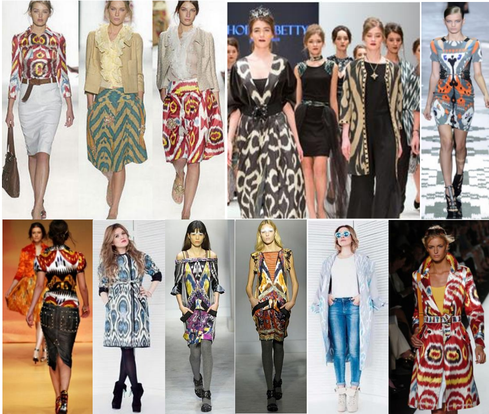
Рис. 2. Використання візерунків за мотивами техніки Ікат у колекціях дизайнерів одягу

Традиційні ікатні візерунки вирізняються цікавою складною геометрією та різноманітністю поєднанням кольорів, яскравими кольоровими переходами (рис. 3). Кольору й характеру орнаменту надають особливого філософського значення. Сім основних кольорів відповідають семи рівням світобудови. Білий – світ розуму, жовтий – світ духу, зелений – світ душі, червоний – світ природи, сірий – світ матерії, темно-зелений – світ образів, чорний – світ матеріального тіла. Візерунки середньоазійського ікату надзвичайно колоритні і виразні. Творчим джерелом колекції обрано стилізований ромбовидний візерунок, що є характерним мотивом багатьох візерунків тканин ікат.