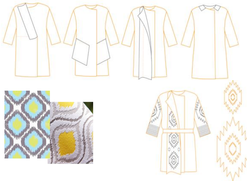
Рис. 4. Технічні рисунки моделей колекції жіночих трикотажних кардиганів, мотив орнаменту та представлення стилізованого візерунку ікат на трикотажному виробі

Технічні рисунки та ескізи моделей трикотажних кардиганів наведено на рис. 4 та рис. 5. Вироби мають прямий силует та оздоблені геометричними в'язальними елементами та аплікацією. Використання формостійкого трикотажного полотна із напіввовняної пряжі дозволило створити гармонійний силует жіночого кардигану, розташувати на ньому декоративні деталі і викласти на гладкому полотні комбінованого переплетення об'ємний декор з шнурків, що імітує орнамент східної тканини ікат.