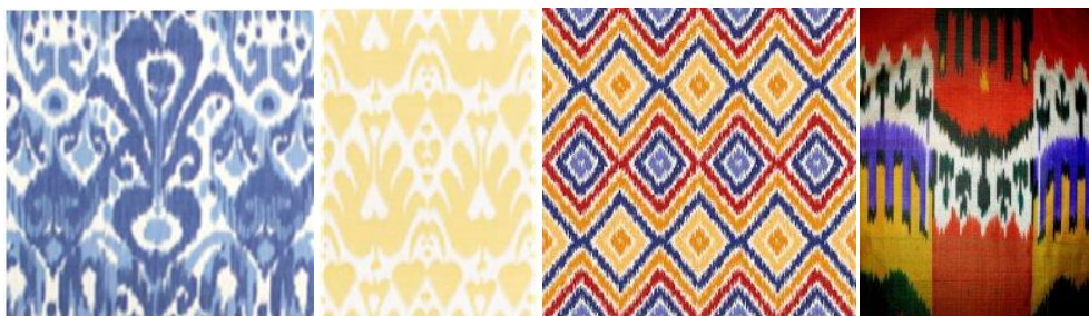
Рис. 3. Різновиди зображень візерунків тканини ікат

Традиційні ікатні візерунки вирізняються цікавою складною геометрією та різноманітністю поєднанням кольорів, яскравими кольоровими переходами (рис. 3). Кольору й характеру орнаменту надають особливого філософського значення. Сім основних кольорів відповідають семи рівням світобудови. Білий – світ розуму, жовтий – світ духу, зелений – світ душі, червоний – світ природи, сірий – світ матерії, темно-зелений – світ образів, чорний – світ матеріального тіла. Візерунки середньоазійського ікату надзвичайно колоритні і виразні. Творчим джерелом колекції обрано стилізований ромбовидний візерунок, що є характерним мотивом багатьох візерунків тканин ікат.