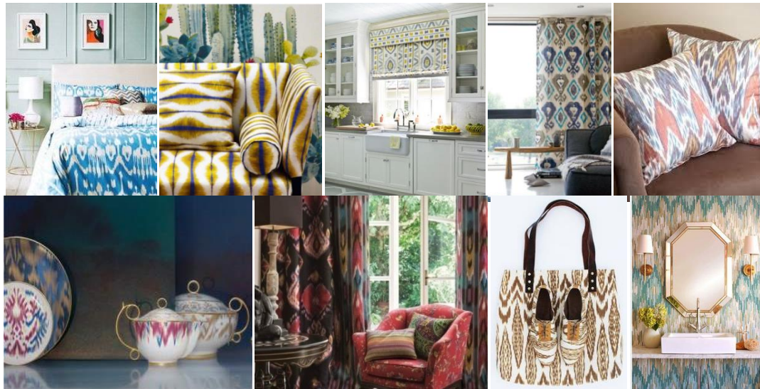
Рис. 1. Приклади використання візерунків техніки ікат в інтер'єрі та аксесуарах