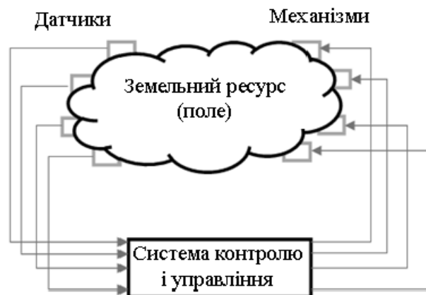
Рисунок 3 – Взаємодія інформаційної технології з полем

Спрощена структурна схема взаємодії інформаційної технології і землеробства представлена на рисунку 3.