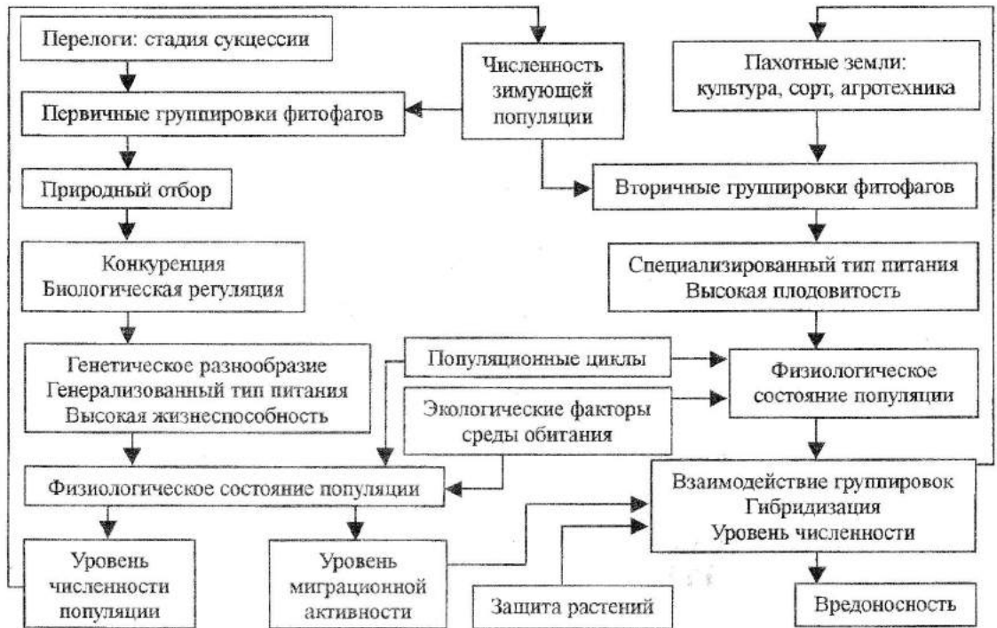
Рис. 3. Модель механизмов влияния выведенных из сельскохозяйственного производства земель на фитосанитарное состояние в Украине.

(кормовая база), а с другой – численностью зимующей популяции. В результате процессов конкуренции и биологической регуляции, питания на растениях с естественной устойчивостью, первичные группировки характеризуются генетическим разнообразием, генерализованным типом питания и высокой жизнеспособностью. Вторичные группировки селекционируются на высокий репродуктивный потенциал, что связано со специализированным типом питания высокоэнергетическими культурными растениями.