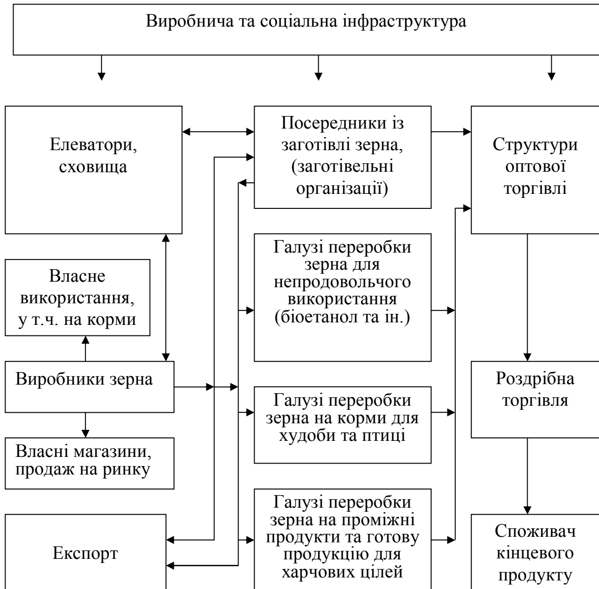
Рис. 1. Схема елементів зернопродуктового підкомплексу АПК