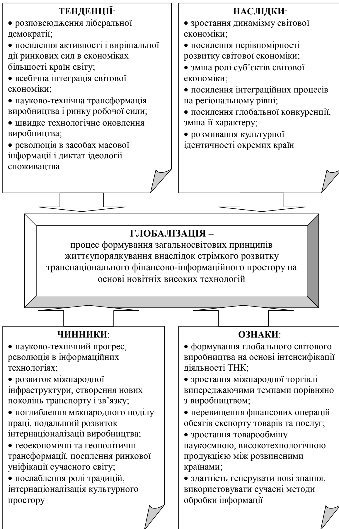
Рис. 1. Тенденції, наслідки, чинники та ознаки глобалізації [9, с. 7]