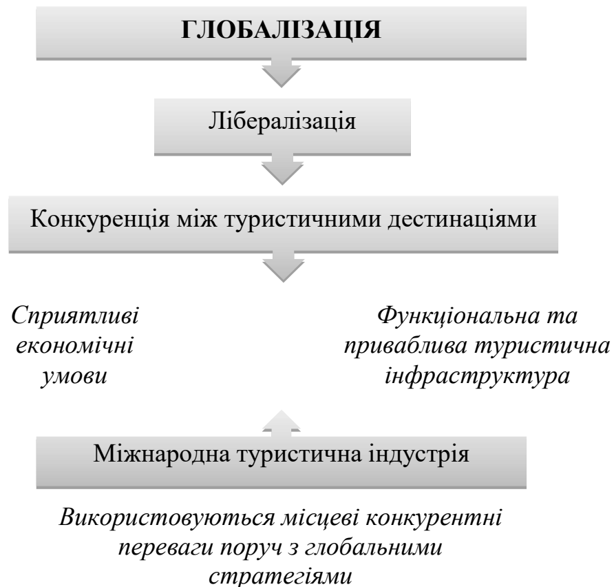
Рис. 2. Створення та реалізація турпродукту за умов глобалізації

Підвищення інтересу до збереження навколишнього середовища в туристичних дестинаціях. Провідні країни та країни, що розвиваються, але прагнуть бути туристичними, втілюють уніфіковані міжнародні екологічні стандарти та контроль за збереженням екологічних систем й цінностей культурної спадщини. Ці заходи є вкрай важливими для забезпечення сталого розвитку туризму та імплементації нових форм туризму, таких як екотуризм та сільський туризм.