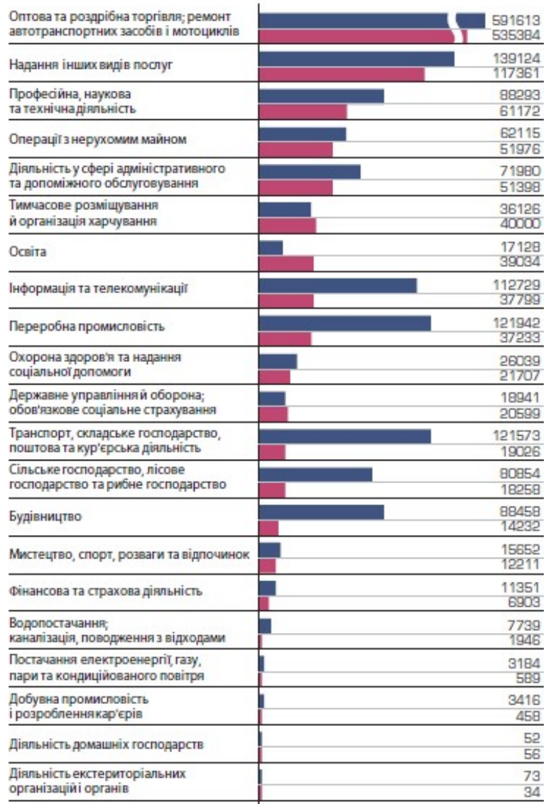
Рис. 2. Розподіл керівників та ФОП за статтю в межах кожної секції КВЕД

У ролі бізнес леді, крім численних переваг, існує і ряд недоліків. По-перше, у більшості ділових жінок залишається дуже мало часу на особисте життя та сім'ю. Ученими встановлено, що поряд з такою бізнес-вумен багато чоловіків відчують себе некомфортно. Багато жінок не заводять дітей до тридцяти п'яти років, присвячуючи себе кар'єрі.