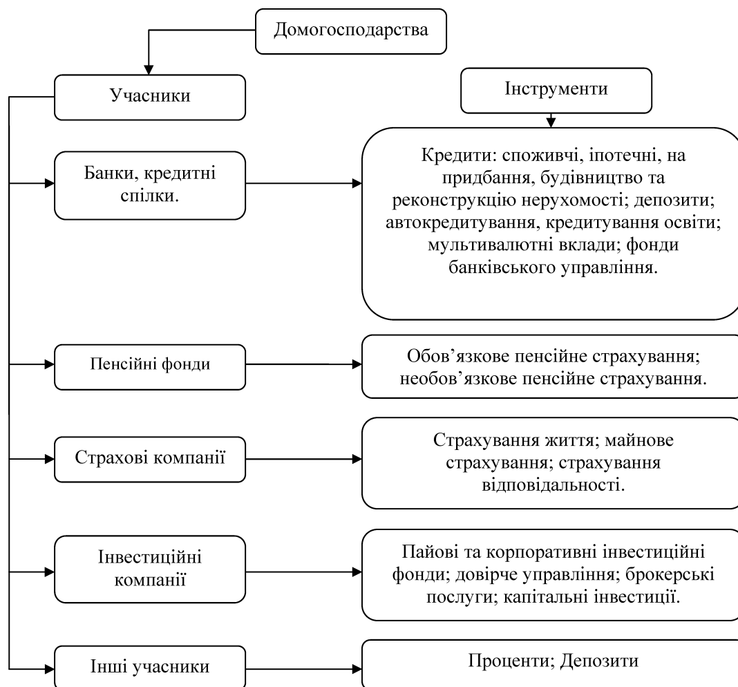
Рис. 1. Основні учасники та інструменти управління фінансовими ресурсами домашніх господарств

Серед усієї сукупності фінансових посередників найважливішу роль у фінансовому забезпеченні добробуту домогосподарств відіграють банківські установи, пенсійні фонди, страхові компанії, кредитні спілки, інвестиційні компанії та інші структури (рис. 1).