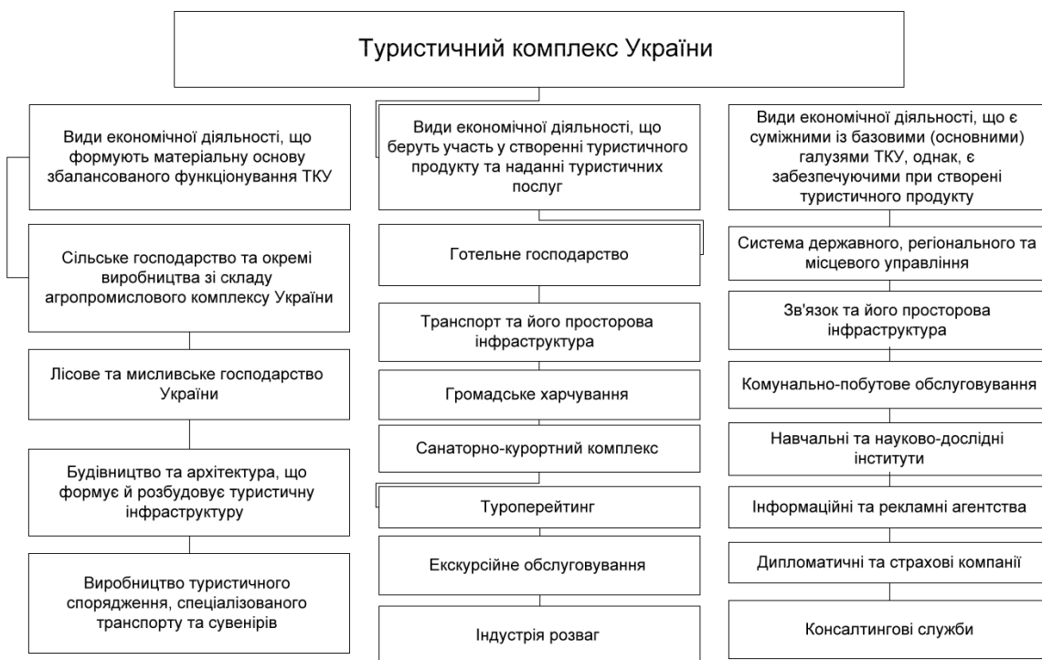
Рис. 3. Візуалізація структури та взаємозв'язків між ключовими галузями та виробництвами, що формують туристичний комплекс України

Висновки. Отже, здійснивши аналіз наукових досліджень нами визначено поняття туристичного комплексу, яке зводиться до ресурсно-функціональної підсистеми, що функціонує в межах системи національного господарства та забезпечує поліфункціональну взаємодію між підприємствами, що обслуговують туристів, діяльність якої спрямована на задоволення їх потреб у оздоровленні, відпочинку та наданні відповідної якості суспільно необхідних та регенеруючих послуг. Здійснено деталізацію місця і ролі туристичного комплексу в системі економіки та управління національним господарством. Виявлено, що розвиток туристичного комплексу відбувається у триєдиній системі координат: економіка та управління національним господарством – регенерація українського соціуму та забезпечення сталого розвитку держави. Обґрунтовано на основі європейських директив та стандарту NUTS, а також положень Національного класифікатору України видів