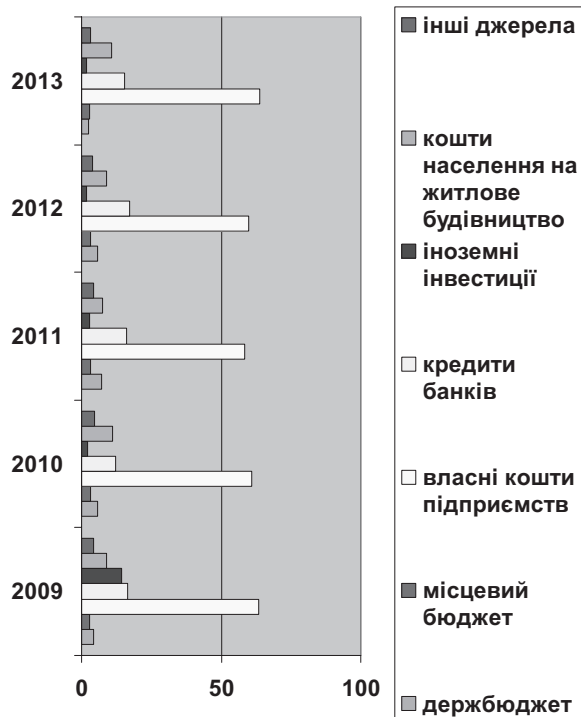
Рис.2 Капітальні інвестиції за джерелами фінансування у % до загального обсягу