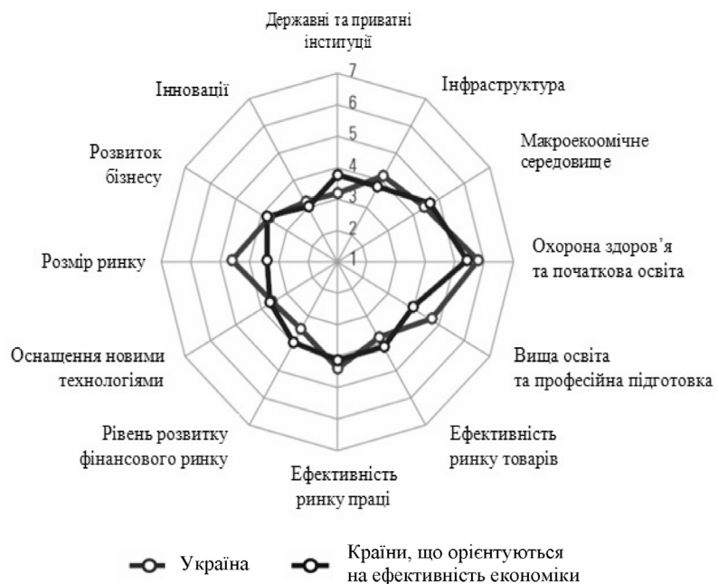
Рис. 2. Показники конкурентоспроможності України в порівнянні з іншими країнами, орієнтованими на ефективність економіки (в балах – від 1 до 7), 2012–2013 рр.

Як видно з таблиці, у 2011–2012 рр. лідером за субфакторами базових вимог і підсилювачів ефективності був Київ. За субфактором інновацій і розвитку першу позицію утримувала