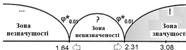
Рис. 3 Вісь значущості

Отже, результат потрапив до зони значущості. Це свідчить про те, що гіпотеза H_0 відкидається. Таким чином, ми дійшли висновку, що кількість студентів, які досягли рівня коефіцієнта навченості за результатами післяекспериментального зрізу, в ЕГ-2 більша , ніж в ЕГ-1. Ці дані дають нам підстави стверджувати, що ефективність методики навчання майбутніх дизайнерів монологу-презентації є вищою.