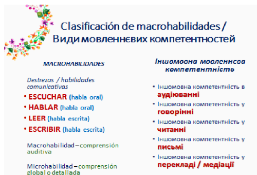
Imagen 2. Clasificación de macrohabilidades o Tipos de la competencia de habla

Con ello y como se señala en la imagen 2 (Ruban, 2018, día. 5), en la didáctica española se destacan así llamadas destrezas o habilidades comunicativas de habla oral y escrita en las que, a su vez, se distinguen dos tipos de habilidades que son macro- y micro- . Las macrohabilidades abarcan las destrezas lingüísticas, como por ejemplo, la comprensión auditiva que incluye tales microhabilidades de la comprensión global o detallada. Si miramos a la columna derecha, veremos una lista de competencias de habla, por ejemplo, la competencia auditiva. ¿Por qué no aparecen en este apartado en la parte de los ucranianos ningunas destrezas o habilidades? Porque, a diferencia de los científicos españoles, que consideran la audición sólo uno de los componentes integrantes y subordinados de la competencia lingüística, los ucranianos le confían todas las características de una competencia “independiente” que necesita ser fomentada como una unidad relativamente autónoma.