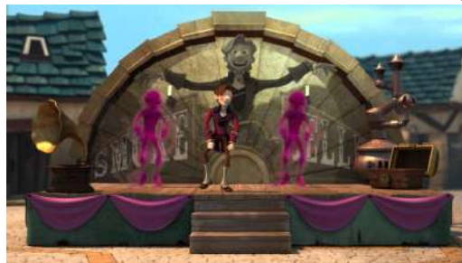
el color de los sueños