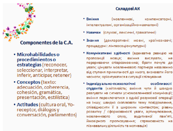
Imagen 3. Componentes de la CA vs. la Ct.A.

En la imagen 3 (Ruban, 2018, día.7) se puede contemplar cuáles componentes constituyen la CA y cuáles representan la Ct.A.