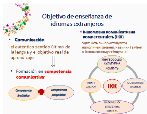
Imagen 1. Objetivos de enseñanza de LE

Así pues, pasamos a nuestra investigación, la myor parte de la cual se basa en los principios de los manuales didácticos “Enseñar lengua” de D. Cassani, M. Luna y G. Sanz, editado en Barcelona (1997) y “Didáctica de lenguas y culturas extranjeras”, compilado por S. Nikolaieva y editado en Kyiv (2013). Según estas piedras angulares didácticas, ambos enfoques tienden a fomentar la competencia comunicativa en LE pero avanzando por diferentes caminos (Imagen 1).