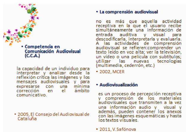
Imagen 4. Competencia en comunicación audiovisual vs. La comprensión audiovisual

así llamada la competencia audiovisual que debe ser formada para trabajar con los materiales audiovisuales en las clases de LE / ELE. Por otro lado, sigue existiendo la escuela didáctica más clásica que basa su convicción en el Marco Común Europeo de Referencias para las Lenguas (2002) según el cual existe sólo así llamada la comprensión audiovisual que no es más que aquella actividad receptiva en la que el usuario recibe simultáneamente una información de entrada auditiva y visual para descodificarla, interpretarla y evaluarla (MCER, 2002, p. 73). La diferencia de las visiones está presentada en la imagen 4 (Ruban, 2018, dia. 16):