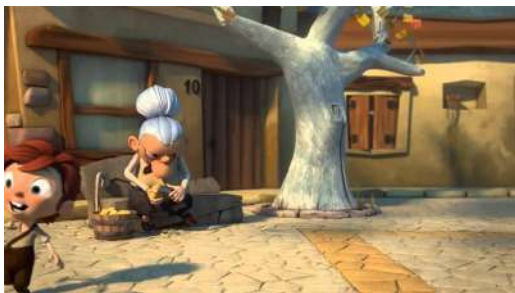
las calles del pueblo, detalles