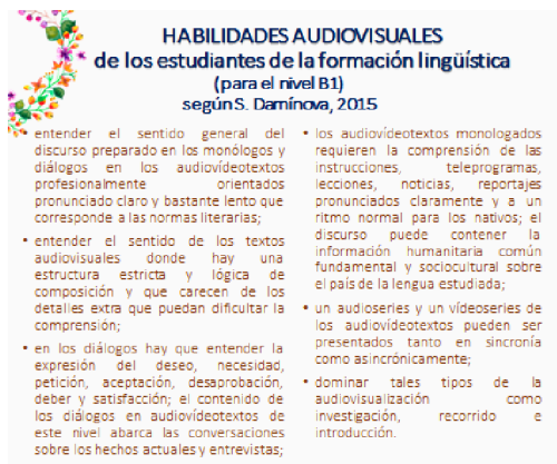
Imagen 5. Habilidades audiovisuales para el nivel B1