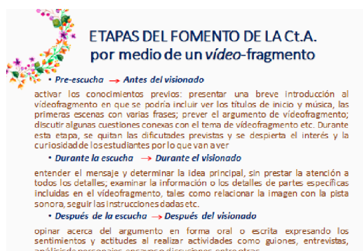
Imagen 7. Etapas de trabajo con un vídeo-fragmento

Las habilidades audiovisuales tanto como las habilidades auditivas mencionadas más arriba deben ser consolidadas y desarrolladas durante todo el proceso de trabajo con tal o cual material didáctico. En el marco de nuestra investigación tenemos que examinar las etapas del trabajo con tal recurso instructivo como vídeo-fragmento (Imagen 7). En comparación con las etapas de trabajo con audiomateriales, las mismas etapas no cambian, sólo se añaden algunos momentos específicos debido al carácter particular del recurso.