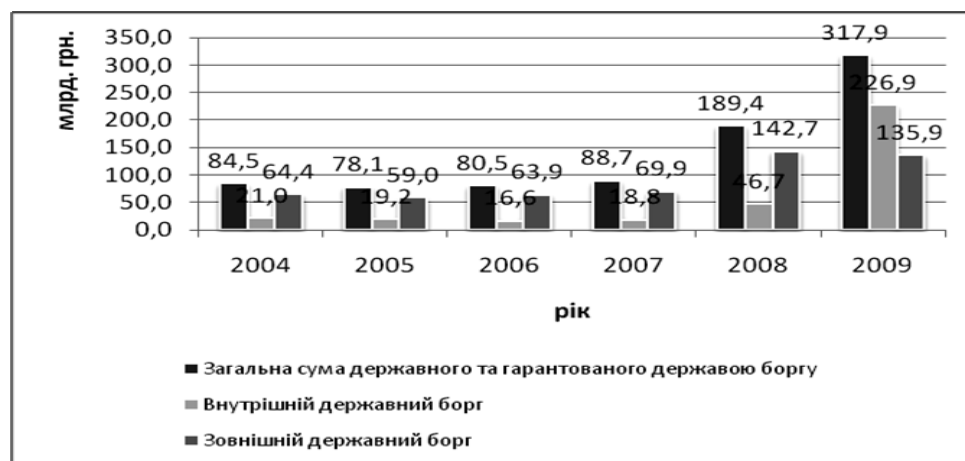
Рис. 1. Показники державної заборгованості України у 2004–2009 рр. [9]

Світова фінансова криза негативно вплинула на ситуацію на фінансових ринках. Це призвело до скасування оптового фінансування і припинення функціонування ринків зовнішнього боргу, неупорядкованого скорочення частки позикових ресурсів у глобальній фінансовій системі. Головне навантаження з підтримки країн, які найбільше постраждали від фінансової кризи, взяв на себе МВФ, який застосовував різні механізми надання фінансової допомоги. Зростання обсягів надання з боку МВФ суверенних позик для країн у кризовий період, у тому числі й Україні, сприяло збільшенню розмірів суверенних боргів. Тобто тенденції до зростання розмірів державних боргових паперів посилилися в умовах світової фінансової кризи, що характерно і для нашої держави. Тенденції зростання державної заборгованості в Україні є нестійкими, вони визначаються поточною політикою держави у сфері запозичень, а також ситуацією у фінансовій сфері. Боргові показники України за 2004–2009 рр. відображено на рис. 1 .