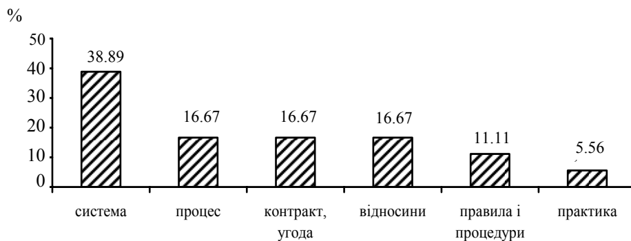
Рис. 1. Підходи до трактування сутності корпоративного управління

По-перше , у трактуванні сутності поняття "корпоративне управління" більшість позицій сфокусовано на сприйнятті досліджуваного поняття як "системи", менш поширеним є сприйняття КУ як "процесу, контракту, угоди, відносин" (рис. 1).