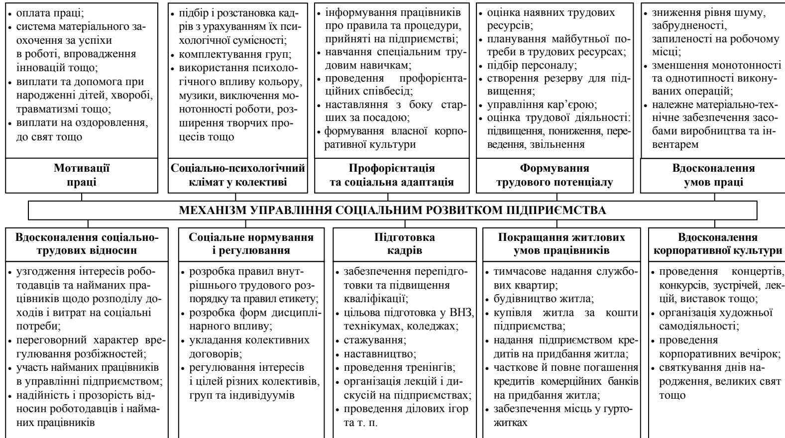
Рис. 2. Ключові фактори впливу на процес імплементації механізму управління соціальним розвитком підприємства (складено автором за [7; 10; 11])