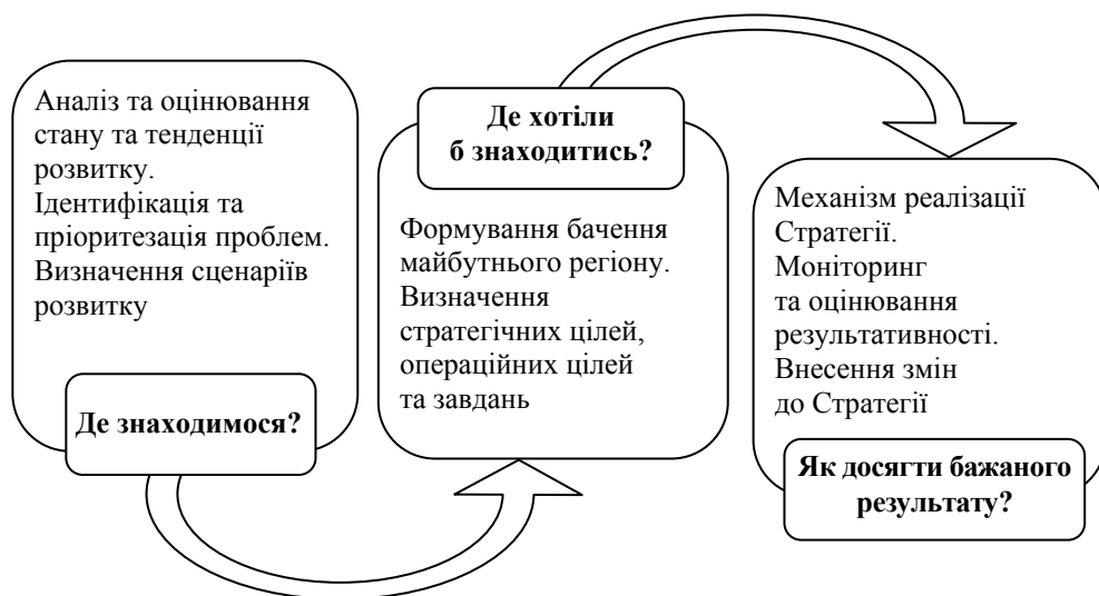
Рис. 1. Концепт стратегічного планування регіонального розвитку

У наукових працях українських та іноземних дослідників визначення поняття "стратегічне планування" має різні формулювання [2, с. 19–22; 3, с. 324]. Під стратегічним плануванням регіонального розвитку розуміємо постійний поетапний процес визначення поточного стану та тенденцій розвитку об'єкта; бажаного стану, умов та якості розвитку; напрямів та шляхів досягнення бажаного стану; відповідальних виконавців і необхідних економічних ресурсів; моніторингу реалізації стратегічних та оперативних цілей і внесення за його результатами змін до Стратегії регіонального розвитку (рис. 1).