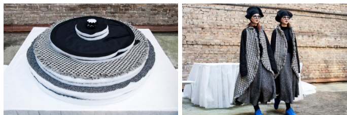
Рис. 3 Модель колекції «Кругова порука» сезону осінь-зима 2016-2017