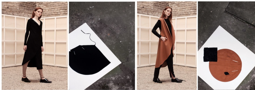
Рис. 2 Моделі колекції «Супрематизм 2.0» сезону весна-літо 2016

Показ Т. Возіанова продемонстрував супрематизм Малевича у дії. Відтак, публіка взяла участь у високого рівня фешн-перформансі, до цього небаченому в українському модному просторі. Резонанс презентації проекту «Супрематизм 2.0» надалі спонукав Т. Возіанова до створення міні-шоу для тематичного показу трьох основних моделей колекції. Вони неодноразово демонструвалися у різних шоу, в тому числі на міжнародній науковій конференції у жовтні 2016 р. у Києві до сторіччя художника: «Казимир Малевич: київський аспект» в НАОМА. Показ супроводжував лекцію професора Д. Антонюка, у якій доповідач наголосив на впливі творчості К. Малевича на сучасну архітектуру і дизайн (Рис. 2), [9].