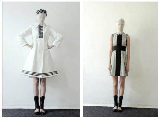
Рис. 1 Моделі колекції сезону весна-літо 2010

Гучний успіх показу колекції та його розголос не стали для Т. Возіанова остаточним підсумком щодо роботи над темою. Через шість років він повернувся до Малевича, якого представив на новому рівні осмислення, з принципово іншим підходом та засобами його втілення. У колекції «Супрематизм 2.0», представленій у сезоні весна-літо 2016, тема авангарду була розкрита вже не шляхом «історіїзації», а шляхом формотворення, коли акцентом став стиль супрематизм, його філософія, втілена через творчі прийоми, методи, засоби та його реалізація через предметний ряд. Т. Возіанов звернувся до «чистої форми», геометричної «конструкції», «математизувавши» крій, домігшись «опредмечення» форми. Прямим «цитуванням» Малевича виглядав суцільний, глибокий чорний колір тканини, суголосний знаменитому «Чорному квадрату», який графічно-живописно набрав образної всезагальності, хоча присутніми були і додаткові кольори – білий, бежевий, світло-коричневий, темно-червоний.