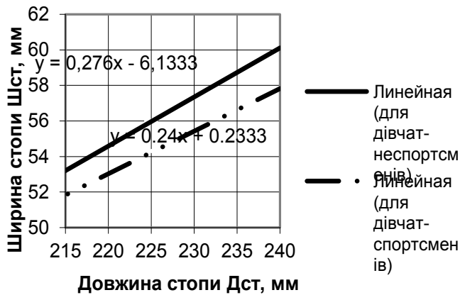
Рис. 1. Регресійна залежність ширини стопи Ш 0,18 від довжини стопи Д ст