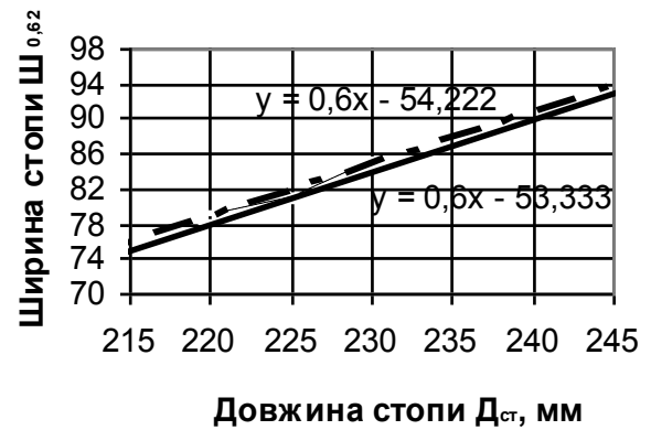
Рис. 2. Регресійна залежність ширини Ш 0,62 стоп дітей танцюристів по зовнішньому пучку від довжини стопи Д ст