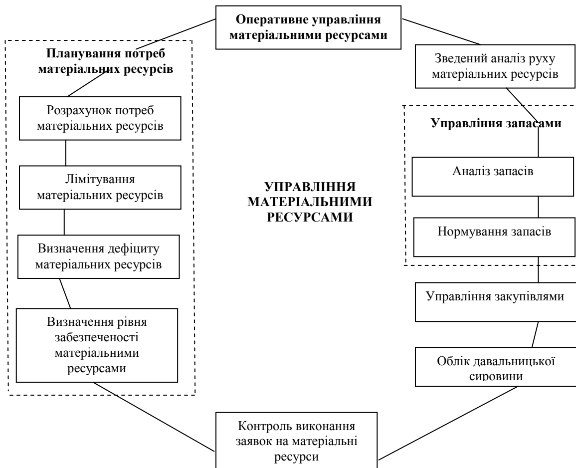
Рис. 2. Схема підсистеми «Управління матеріальними ресурсами»

Системний підхід у вирішенні задач логістики, програмне забезпечення дозволяє значно підвищити ефективність цієї сфери діяльності підприємства.