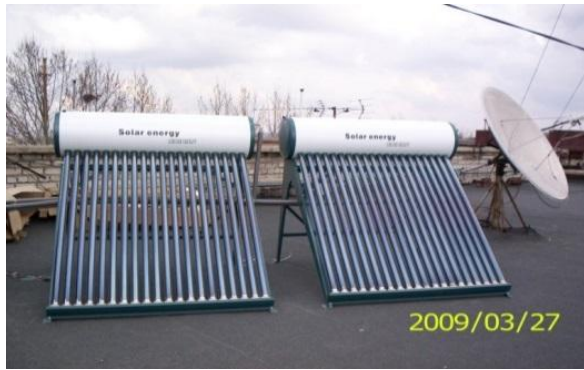
Рис. 5. Геліоколектори на даху головного корпусу ЧДУ ім. П. Могили