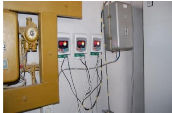
Рис. 6. Автоматизована система контролю за геліоустановкою

На головному корпусі університету планується встановлення вітрової установки, яка б працювала в комплексі з сонячною, забезпечуючи електричний підігрів води у баку-акумуляторі.