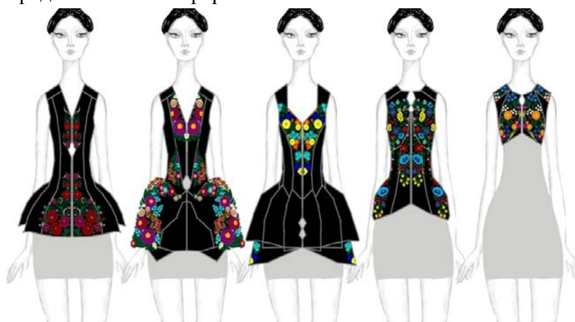
Рис. 5. Колекція модернізованих жіночих корсеток з варіантами розміщення орнаментів

Обрано сучасну біластичну тканину, яка гарно тримає форму. Виразність ліній членування підсилена використанням декоративних швів, що виконано кольоровими нитками. Варіанти орнаментів та їх розміщення на розроблених формах жилетів з виділенням конструктивно-декоративних ліній, наведено на рисунку 5. Авторська колекція орнаментів виконана машинною вишивкою на сучасному автоматичному обладнанні. Створено модельний ряд стилізованих форм жіночих жилетів