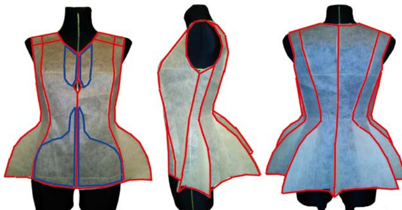
Рис. 3. Фото моделювання жилетки муляжним методом для досягнення бажаної форми

Нами створено зовнішню форму та побудовано модельний ряд жіночих жилетів, розроблено конструкцію виробів. На рисунку 3 представлено конструктивні лінії та місця розташування орнаментів спроектованих жилетів.