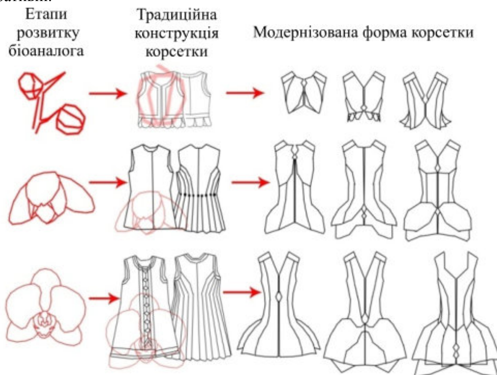
Рис. 1. Матриця біотектонічних перетворень жіночого жилету на основі форми орхідеї

Декоративному оформленню жилетів передують дослідження різноманіття українського орнаменту. Відомо, що застосування орнаментів у одязі всіх народів виконує функцію оберегів. При цьому, український орнамент має безліч мотивів-символів, які слугують оберегами та мають різні сфери застосування (весільні, родильні тощо). Проте перехід від умовно-геометричних мотивів до реалістичніших, таких, які точніше передають живі форми, йшов паралельно з розвитком декоративності і перетворював орнаменти інформативні на більш декоративні.