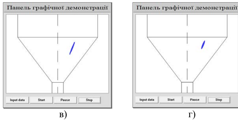
Рис.2. Комп'ютерна модель впливу співвідношення в'язкостей полімеру дисперсної фази і матриці на деформацію краплі: K = 1.0 (а); K = 2.5 (б); K = 6.7 (в); K = 10.0 (г)

Відомо, що дисперсійне середовище при течії діє на дисперговану в ньому краплю з силою, яка зможе деформувати її, якщо є достатня взаємодія між двома полімерами суміші в перехідному шарі. Із фундаментальних співвідношень щодо термодинамічної рівноваги в дисперсних системах витікає, що найбільш дієвим фактором, який дозволяє регулювати параметри фазової структури, є величина міжфазного натягу. З точки зору термодинаміки, поверхневий натяг — це робота утворення одиниці площі нової поверхні шляхом розтягнення старої. Питома робота диспергування пропорційна величині міжфазного натягу, тобто зниження його підвищує ступінь деформації, що дає можливість отримувати більш тонкі мікрОВОлокна. Це наглядно підтверджується анімацією, представленою на рис. 3.