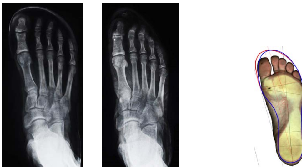
Рис.1 Співвідношення стопи та різної (спортивної та класичної)внутрішньої форми взуття – основа для проектування раціональної форми сліду колодки

Особливу увагу при проектуванні сліду колодки приділяли формі носкової частини, яка в багатьох випадках не відповідає вимогам біомеханіки та фізіології стопи, особливо під час активних дій та тривалого носіння. Особливо актуальні ці вимоги для спортивного та військового взуття.