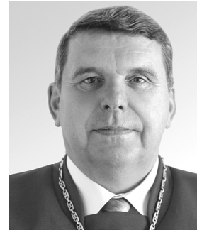
суддю Конституційного Суду України у відставці, заслуженого юриста України ПШЕНИЧНОГО Валерія Григоровича з 60-річчям!

Бажаємо вам, шановні ювіляри, бадьорого настрою, здоров'я і довголіття! Нехай життя дарує усі земні гаразди, а підтримка рідних і повага друзів повсякчас будуть вам надійною опорою!