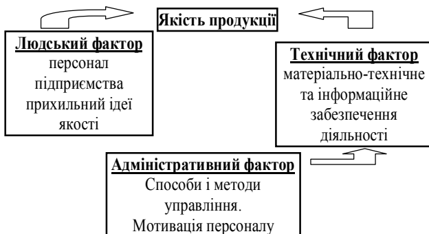
Рис. 5. Вплив сертифікації персоналу на якість продукції

Постійне вивчення сильних та слабких сторін персоналу, виявлення факторів, якими можна позитивно впливати на продуктивність роботи та мотивацію працівників, надасть можливість підприємствам різних галузей народного господарства скоріше вийти з кризового стану. Україні потрібно більш впевнено переходити на “тверді” стандарти світової спільноти та гармонізувати свою номенклатурну базу з міжнародною.