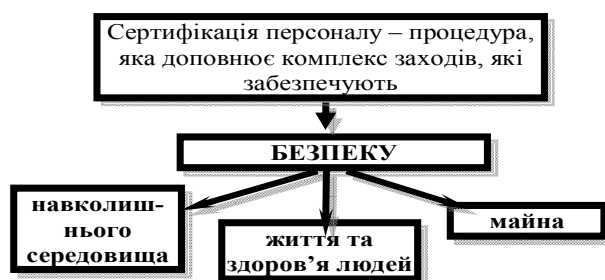
Рис. 3. Об'єкти безпеки сертифікації персоналу

Сертифікація персоналу – одне з правил, які діють у СОТ та ЄС. Незалежне оцінювання дозволить провести внутрішній аналіз з боку керівництва кваліфікації робітників, навчити робітників у тих галузях, в яких виявлена їх невідповідність.