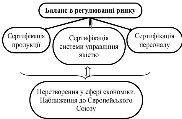
Рис. 4. Правила COT з сертифікації персоналу

Сьогодні такі поняття, як “кадровий потенціал” і “людський капітал” набувають все більшої актуальності. В умовах, коли бізнес-стратегії і технології перестають бути вирішальним фактором у конкурентній боротьбі, на передній план виходить фактор персоналу. Закордонні компанії близько 20% прибутку витрачають на навчання своїх працівників. Чим більший їх професіоналізм, який виражається в знаннях, уміннях, тим більша ймовірність у підприємства стабільно випускати якісну продукцію.