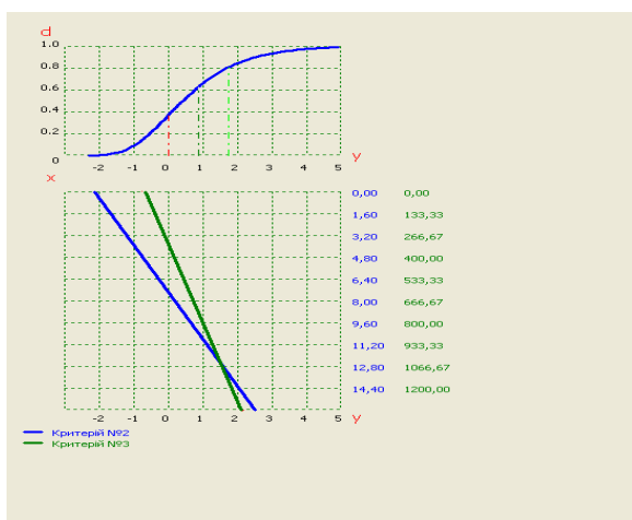
Рис. 1.б. Номограма худ для показників гігроскопічності та стійкості до стирання

За допомогою наведених на рис. 1.а-1.в номограм можна перевести будь-який розмірний показник x у безрозмірний показник бажаності d .