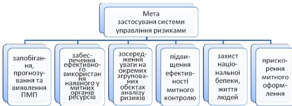
Рис. 3. Мета застосування системи управління ризиками [5].

Практична відсутність науково-дослідних розробок зазначених проблем, з одного боку, а з іншого – відсутність комплексної системи контролю