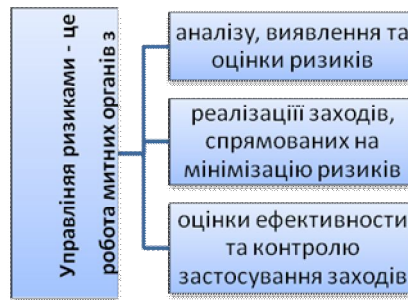
Рис. 2. Структуро-логічна схема визначення поняття «Управління ризиками» [8].

Управління ризиками є ефективним інструментом прискорення товарообігу у міжнародному ланцюгу поставок товарів «виробник-споживач». Митні органи застосовують систему управління ризиками з метою визначення товарів, які підлягають митному контролю, форм та обсягу митного контролю [13] (рис. 3).