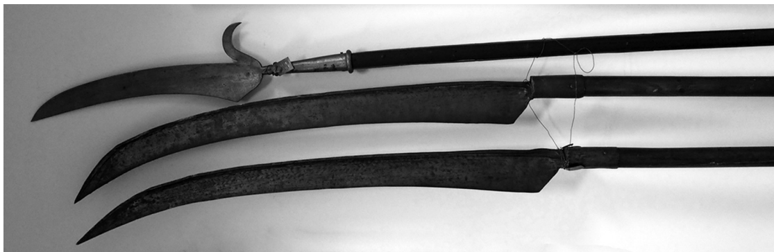
Рис. 3. Бойові коси XIX ст. ЛІМ. Інв. № 3 — 3547, 3 — 3548