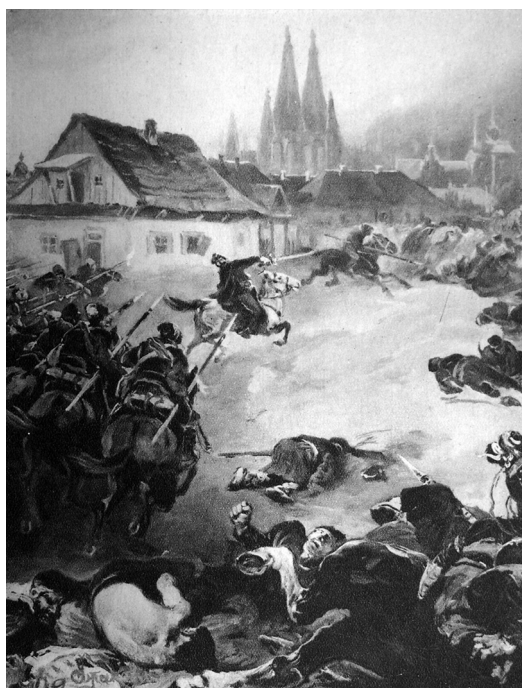
Рис. 2. І. Їжакевич. „Повстання гайдамаків під керівництвом М. Швачки”. ЛІМ