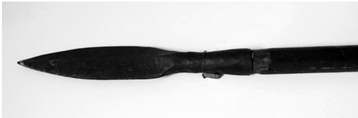
Рис. 4. Спис XVII ст. ЛІМ. Інв. № 3—3925