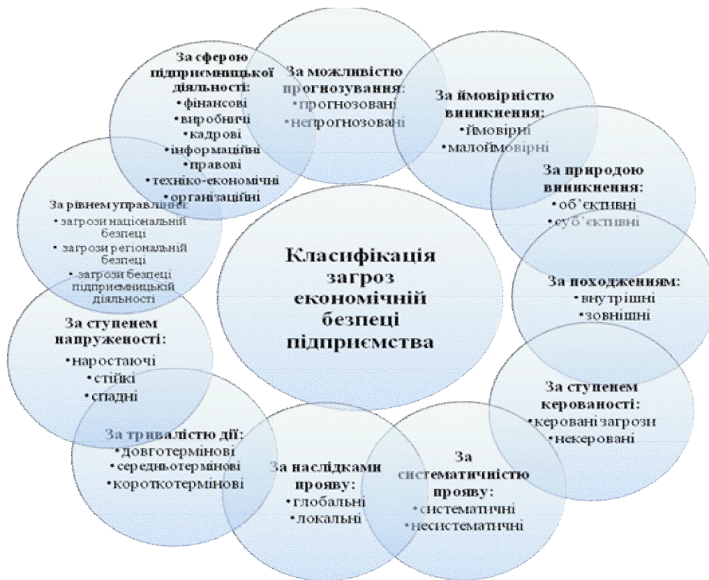
Рис. 1. Класифікація загроз економічній безпеці підприємства

Василенко В. А. виділяє такі класифікаційні ознаки (рис. 1):