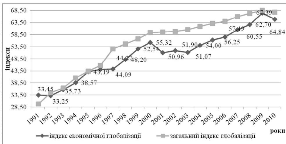
Рис. 1 Динаміка індексу глобалізації за 1991-2010 рр.