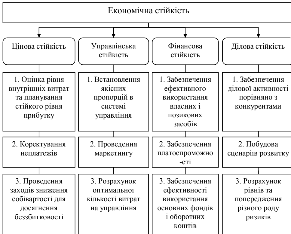
Рис. 1. Структура економічної стійкості підприємства [7]

Тому, враховуючи особливості економічної стійкості підприємства, зазначимо, що її складовими є: