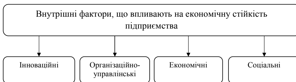
Рис. 3. Класифікація внутрішніх факторів, що впливають на економічну стійкість промислового підприємства

Внутрішні фактори безпосередньо впливають на процес виробництва продукції, визначають рівень конкурентоспроможності підприємств. Внутрішні фактори (рис. 3) формують підприємство як систему взаємопов'язаних елементів, що забезпечує досягнення цілей функціонування підприємства.