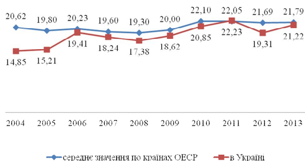
Рис. 2. Динаміка частки видатків на задоволення соціальних потреб у ВВП в Україні та в країнах ОЕСР у 2004-2013 рр.

Джерело: розраховано автором на основі [4].