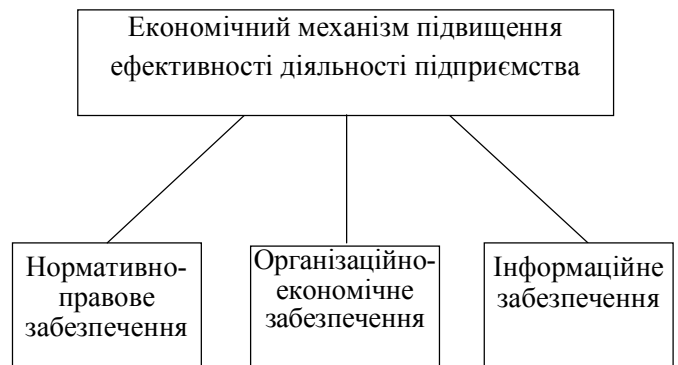
Рис. 3. Складові економічного механізму підвищення ефективності діяльності підприємства [3, с. 42-43]

Механізм економічного механізму підвищення ефективності діяльності підприємства необхідно розглядати як сукупність декількох складових. Спираючись на зроблений вище висновок, згідно з яким загальні теоретичні та практичні положення щодо побудови економічного механізму підвищення ефективності діяльності підприємства можна застосовувати в процесі розробки механізму управління його ефективністю, класифікації механізму управління підприємством є придатними для систематизації механізмів управління ефективністю їх діяльності [9, с. 49-50].