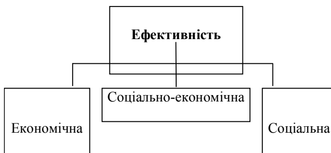
Рис. 1. Видова класифікація ефективності [6, с. 24-32]

Логічним відправним пунктом для подальшого аналізу буде вивчення та узагальнення думок теоретиків щодо видової класифікації ефективності, оскільки класифікація є науковим прийомом поглибленого вивчення будь-яких явищ дійсності. Найбільш поширеною є класифікація, згідно з якою ефективність виступає в трьох видах – економічна, соціальна, соціально-економічна (рис. 1).