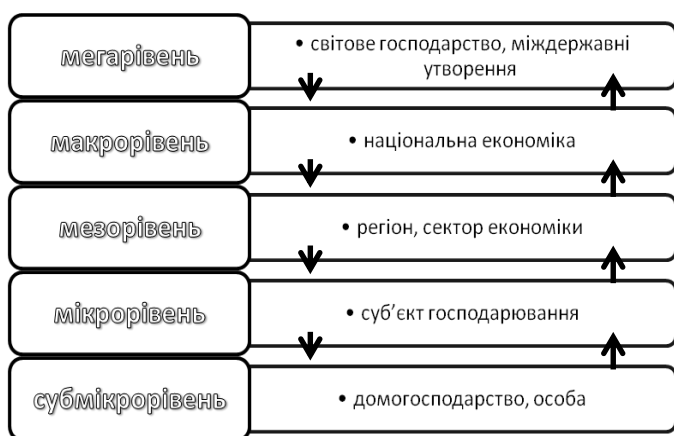
Рис. 2. Ієрархічні рівні економічної безпеки соціальних систем

У фокусі відносин економічна безпека розглядається як така її система, що забезпечує оптимальне використання економічного потенціалу соціальної системи навіть за несприятливих умов. Також в основу дефініції економічної безпеки покладають збалансованість і стійкість економічних параметрів соціальної системи при негативному впливі чинників ендо- та екзогенного характеру. Окрім того, її означають як особливий інструмент впливу на суспільні процеси, котрий гарантує добробут їх учасникам у непередбачуваних умовах.