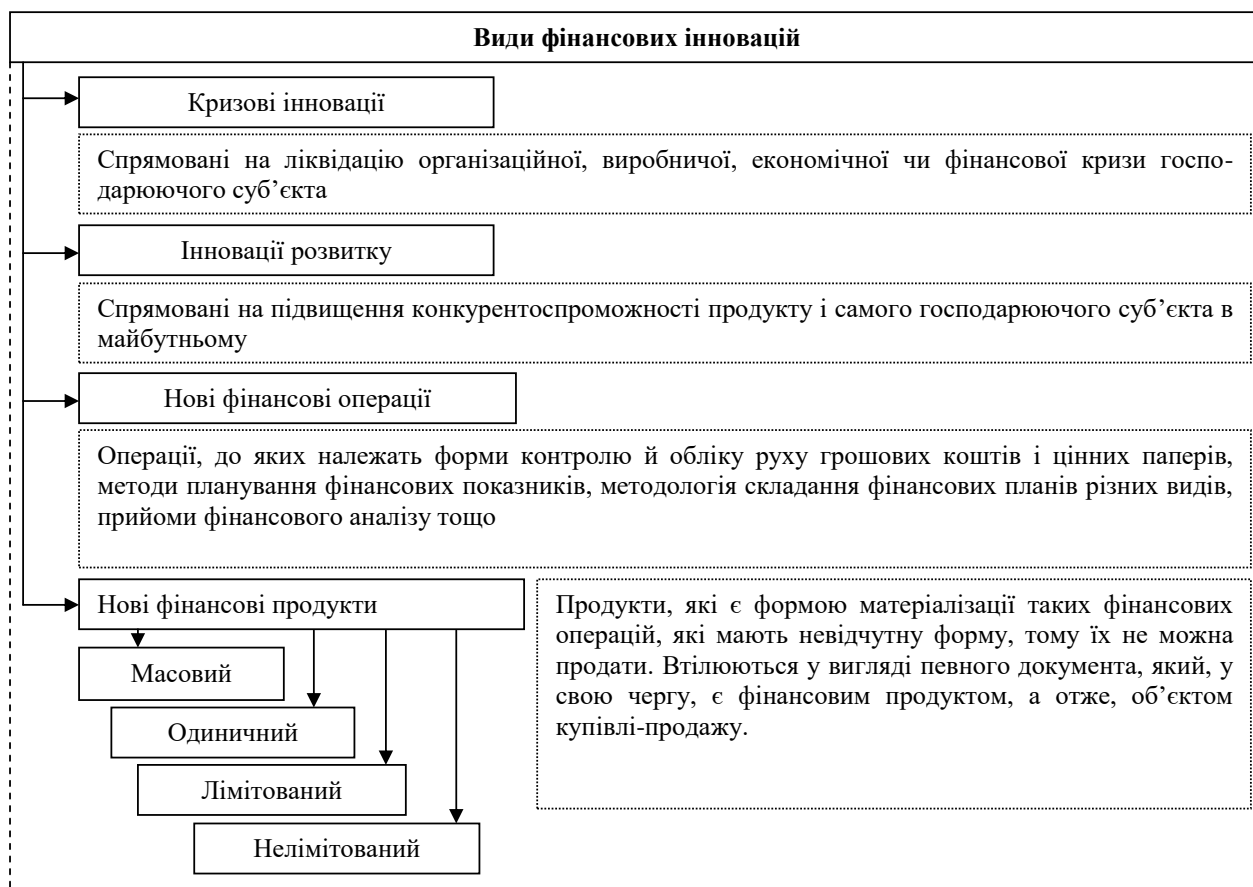
Рис. 1. Види фінансових інновацій