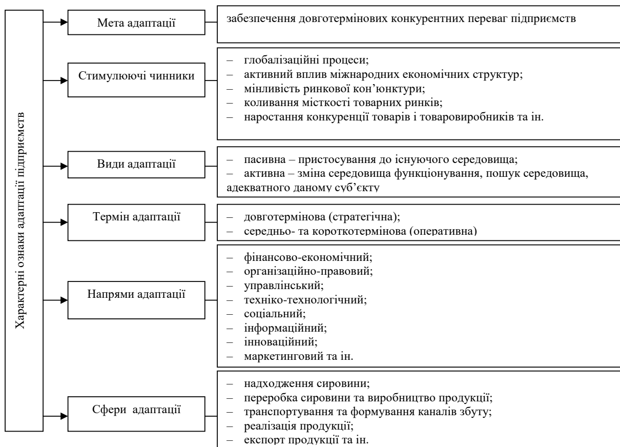
Рис. 1. Характерні ознаки адаптації підприємств

Економічний механізм адаптації підприємств, на наш погляд, передбачає використання таких методів управління, як аналіз, оцінювання, прогнозування (планування), реагування, контроль. Кожен із